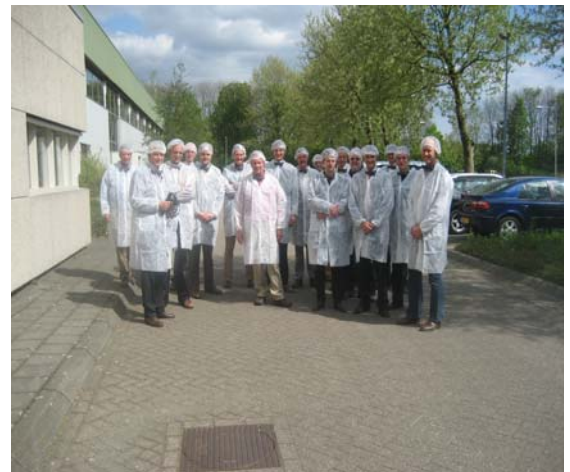
Foto 1. Bedrijfsbezoek EDI-Cow aan de kaasfabriek van Campina te Born

Hierbij zal gekeken worden naar de ervaringen met XML-berichtuitwisseling en SOAP-webservices in de rundveehouderij en rondom het XML-Factuurbericht. De keuze van de syntax en het protocol staan nog open; ADIS versus XML-berichten, FTP versus webservices. Voor EDI-Zuivel is er bijvoorbeeld voor gekozen om de bestaande ADIS-berichten in een XML-schil via SOAP-webservices te communiceren. Voor het XML-factuurbericht is gekozen voor een volledig XML-bericht.